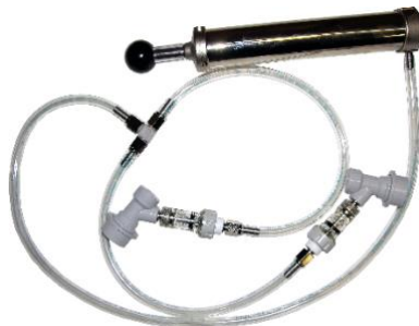
Luftpumpe mit T-Verteiler