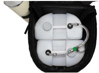
Pumpe mit T-Verteiler an Rucksack Kombi 2x 15-Liter