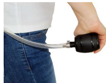
Fässchenpumpe zur Schankdruckerzeugung