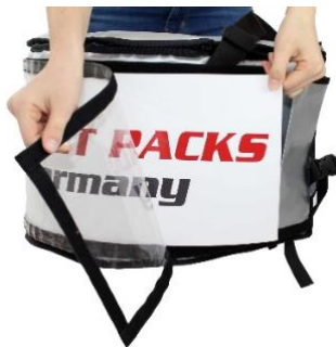
Flexibler Wechsel der Werbebotschaft