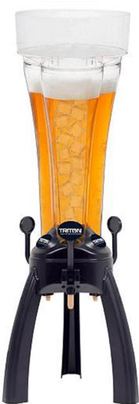
SKY 5 Liter inkl. Kühlröhre für Eiswürfel

Tisch-Zapf-Modell ... Simultanes Getränkezapfen von drei Zapfhähnen! Geeignet zum Zapfen von Getränken aller Art, ganz gleich ob mit oder ohne Kohlensäure (Vorzugsweise Kalt). Lieferung inkl. Reinigungsbürste, Kühlröhre für Eiswürfel (optional auch mit Kühlblock einsetzbar) und Aufsatz.