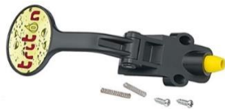
Zapfhahn mit Schraubensatz