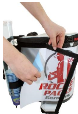
Flexibler Werbeeinleger hinter Folien-Sichtfenster