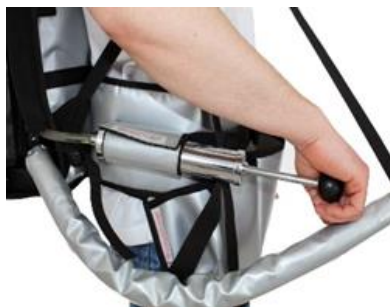
Luftpumpe für Schankdruck