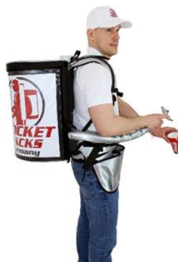
Pro 11-Liter – garantiert einen professionellen Markenauftritt

Professioneller Getränkerucksack Isolierung bis zu 4 Stunden