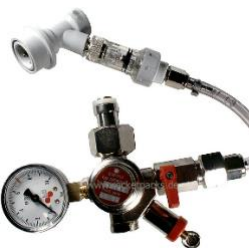
RP1102HIWI Mini-Druckregler 3 bar