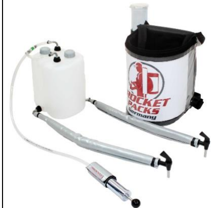
Abbildung Lieferumfang Einsatz CO2-haltige Getränke