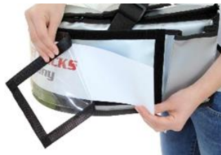
Flexibler Wechsel der Werbebotschaft