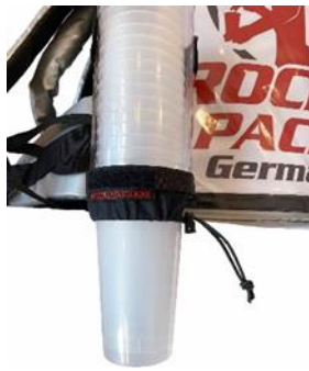
Universal Becherspender für Einweg- & Mehrweg-Becher