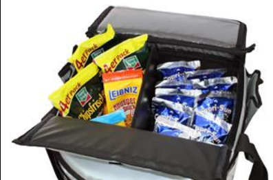
Flexibler Raumteiler, sorgt für Ordnung im Bauchladen