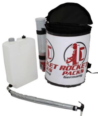
Abbildung Lieferumfang Einsatz stille Getränke