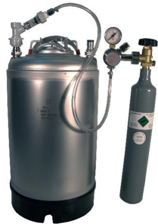
RP1101F & RP1102HIWI angebracht an 11-Liter Behälter