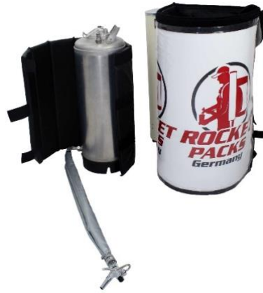
Abbildung Lieferumfang Einsatz stille Getränke