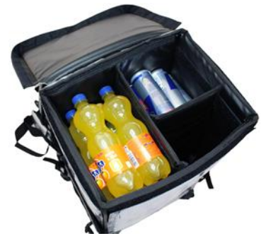
2 Depotkammern mit Ladevolumen für jeweils 15 Stück Dosen oder Flaschen bis 500 ml