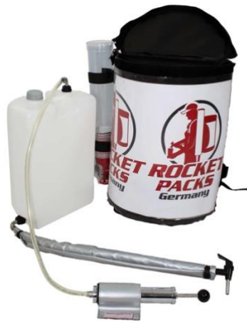
Abbildung Lieferumfang Einsatz CO2-haltige Getränke