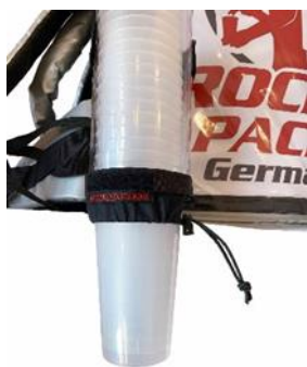
Universal Becherspender für Einweg- & Mehrweg-Becher