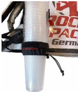
Universal Becherspender für Einweg- & Mehrweg-Becher