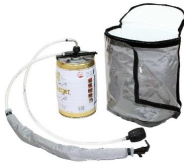
Lieferumfang Party-Pack für 5 Liter ALU Bierdose