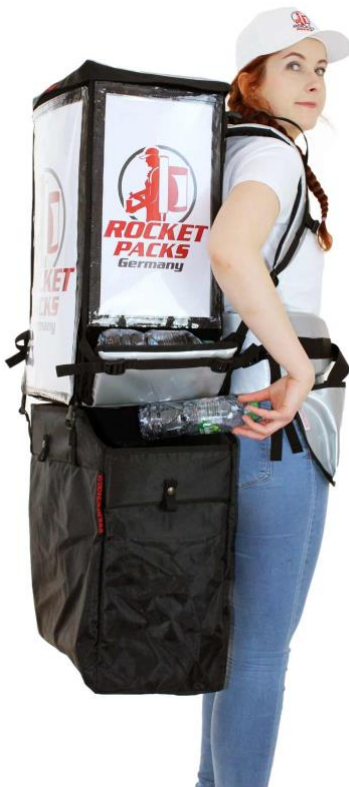
Twin Pack mit Abfalltasche für Entsorgung des Leergutes

Der „Twin Pack“ Dosen & Flasche Rucksack mit Isolierung ist das ideale, mobile Verteilsystem für handelsübliche Getränkedosen und Flaschen (PET & Glas) bis 500 ml, sowie verpackten Produkten aus dem Food und Non-Food Bereich. Perfekt geeignet zur Ergänzung und Erhöhung der Promotion- und Verkaufskapazitäten.