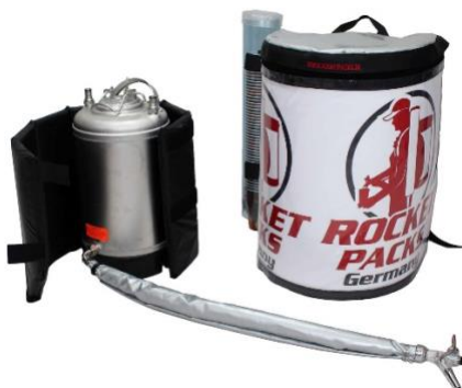
Abbildung Lieferumfang Einsatz stille Getränke