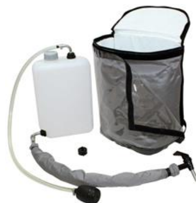
Abbildung Lieferumfang Einsatz CO2-haltige Getränke