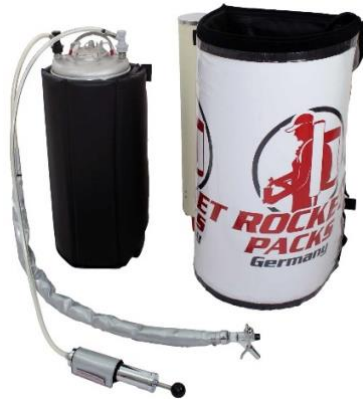
Abbildung Lieferumfang Einsatz CO2-haltige Getränke