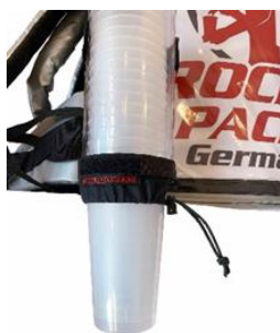
Universal Becherspender für Einweg- & Mehrweg-Becher