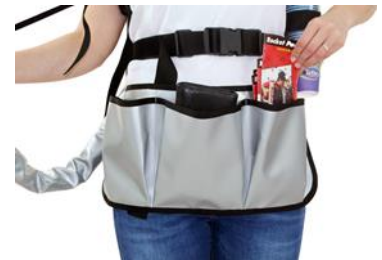
Gastro Vorbinder mit 3 Taschen