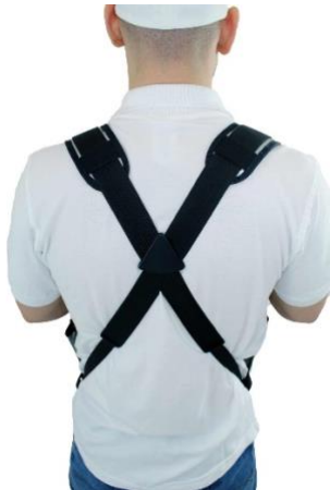
Ergonomisches Tragegurtsystem mit verstellbaren Schulterpolstern

Besonders gut geeignet für Einsatz mit Dosen & Flaschen 500 ml!