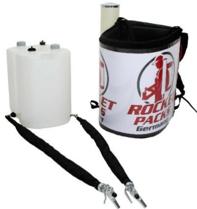
Abbildung Lieferumfang Einsatz stille Getränke