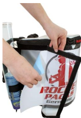
Flexible Werbegestaltung durch Papiereinleger hinter Folienfenster