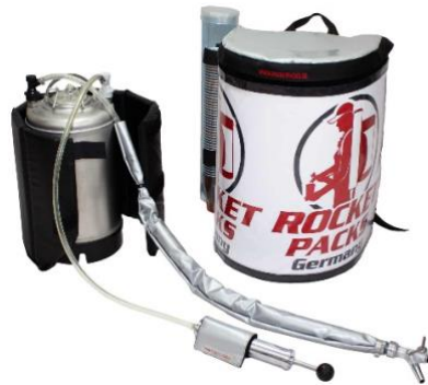
Abbildung Lieferumfang Einsatz CO2-haltige Getränke