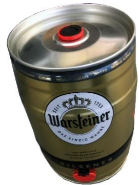
5 Liter Bierdose