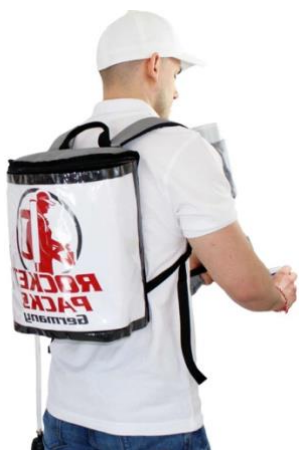
Abbildung Lieferumfang Einsatz stille Getränke

Einfacher Getränkeucksack, mit mäßiger Isolierung, für jede spaßige Gelegenheit einsetzbar. Vorzugsweise für Kaltgetränke geeignet. Bei stillen Getränken erfolgt die Leerung durch das natürliche Gefälle. Kein Druckzubehör erforderlich. Bei Einsatz mit CO2-haltigen Getränken, wird die Fässchenpumpe als Druckzubehör benötigt.