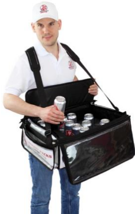
Großraumbauchladen mit Thermoisolierung

Großraum Bauchladen, thermoisoliert, für vielseitigen Einsatzbereich. Hochwertige Materialien und Verarbeitung sorgen für Stabilität und Belastbarkeit. Klappdeckel abnehmbar, Tragegurtsystem mit verstellbaren Schulterpolstern im Rücken über Kreuz gewährleisten höchsten Tragekomfort. Zwei Seitentaschen außen. Front und ein Klappdeckel flexibel, werblich dekorierbar.