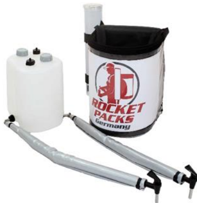
Abbildung Lieferumfang Einsatz stille Getränke