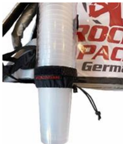
Universal Becherspender für Einweg- & Mehrweg-Becher