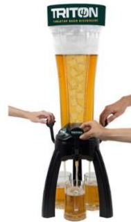
Simultanes Zapfen durch drei Zapfhähne