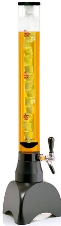
Abbildung Bier-Tower 3 Liter

Getränk­eröhre aus bruchfestem Polycarbonat