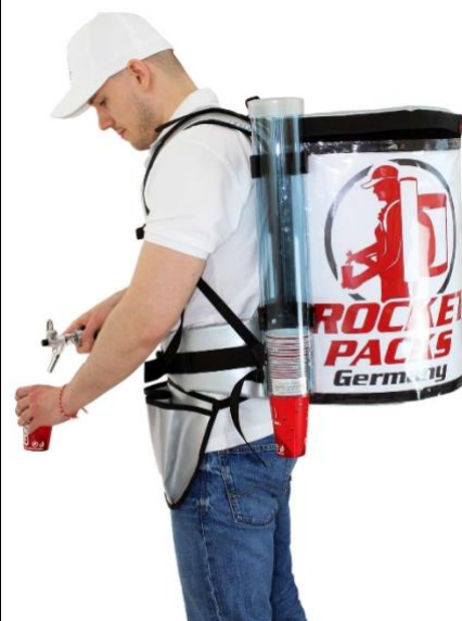
Professioneller Getränke-Rucksack Isolierung bis zu 4 Stunden