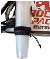
Universal Becherspender für Einweg- & Mehrweg-Becher

Getränke Rucksack mit Isolierung (bis zu 2 Std.). Für Ausschank von zwei Produktsorten aus einem Rucksack. Vorzugsweise für Kaltgetränke geeignet. Bei stillen Getränken erfolgt die Leerung über natürliches Gefälle. Es wird kein zusätzliches Druckzubehör benötigt.