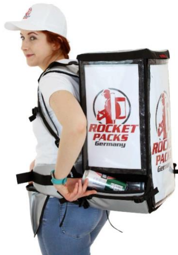
Flexibel tauschbare Werbebotschaften!