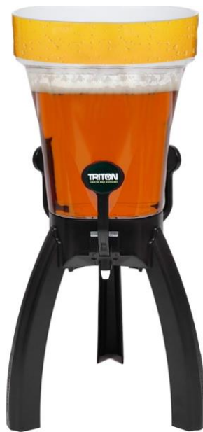
Classic 5 Liter