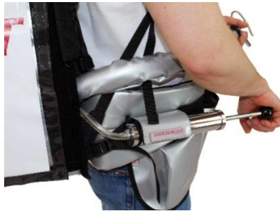
Pumpe angelegt an Rucksack