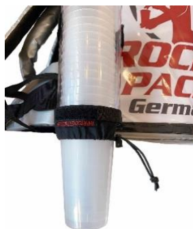
Universal Becherspender für Einweg- & Mehrweg-Becher