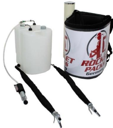
Abbildung Lieferumfang Einsatz CO2-haltige Getränke