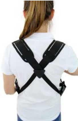
Ergonomisches Tragegurtsystem mit verstellbaren Schulterpolstern

Praktischer Bauchladen, thermoisoliert, für vielseitigen Einsatzbereich. Hochwertige Materialien und Verarbeitung sorgen für Stabilität und Belastbarkeit. Klappdeckel abnehmbar, Tragegurtsystem mit verstellbaren Schulterpolstern im Rücken über Kreuz gewährleisten höchsten Tragekomfort. Zwei Seitentaschen außen. Front und ein Klappdeckel flexibel, werblich dekorierbar.