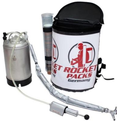
Abbildung Lieferumfang Einsatz CO2-haltige Getränke