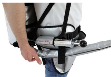
Luftpumpe für Schankdruck an Beckengurt fixiert