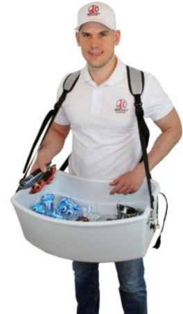
Eis-Bauchladen ohne Frontfolie & Deckel