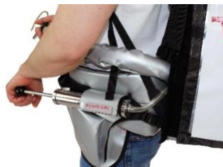
Luftpumpe für Schankdruck

Die XL-Variante des Professionellen mobilen Getränke-Service!