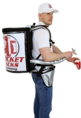
Pro 11-Liter – garantiert einen professionellen Markenauftritt