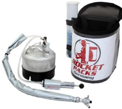
Luftpumpe für Schankdruck