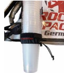
Universal Becherspender für Einweg- & Mehrweg-Becher

...vorzugsweise für Kaltgetränke geeignet!