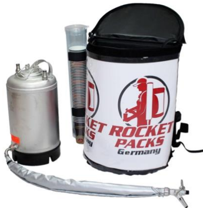
Abbildung Lieferumfang Einsatz stille Getränke