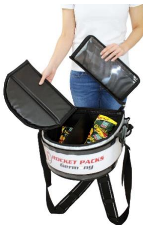
Klappdeckel komplett abnehmbar