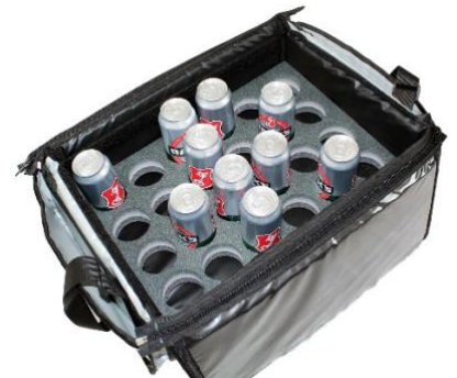
Loch Ø 70 mm, Höhe 50 mm